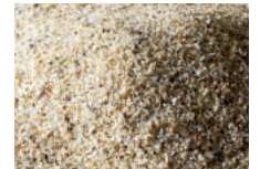
Perlmutter 0,8 - 1,2 mm