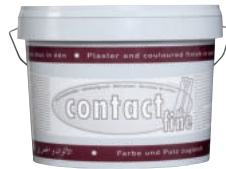
Tierrfino contact fine Haftgrund