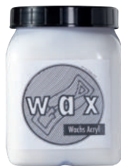
Tierrfino wax Acryl

Fordern Sie uns! Wir beraten Sie gern und finden eine optimale Lösung, um in Ihren Räumlichkeiten mit Lehm und Kalk ein gesundes und elegantes Wohnumfeld zu schaffen.