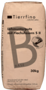
Tierrfino Base Lehmunterputz