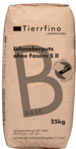
Tierrfino Base Lehmoberputz