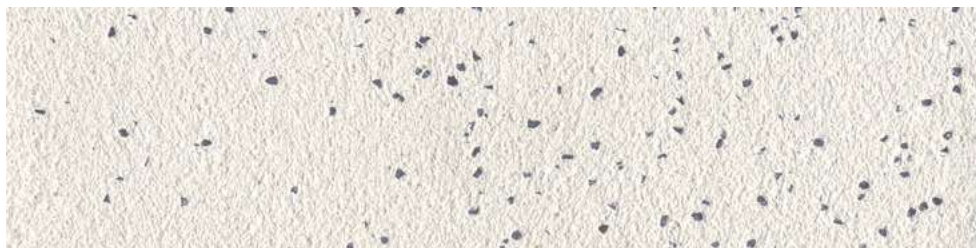
Tierrfino X-WHITE , mit Nero Ebano 3% gefilzt