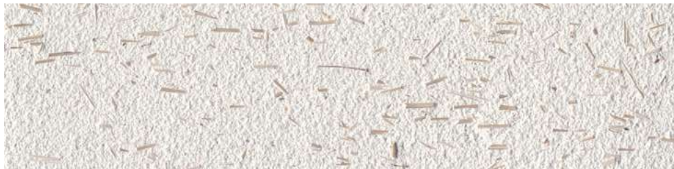
Tierrfino X-WHITE , mit Flachsfasern 0,5% gefilzt