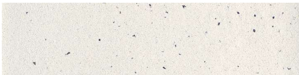
Tierrfino X-WHITE , mit schwarzem Glimmer 3%, geglättet