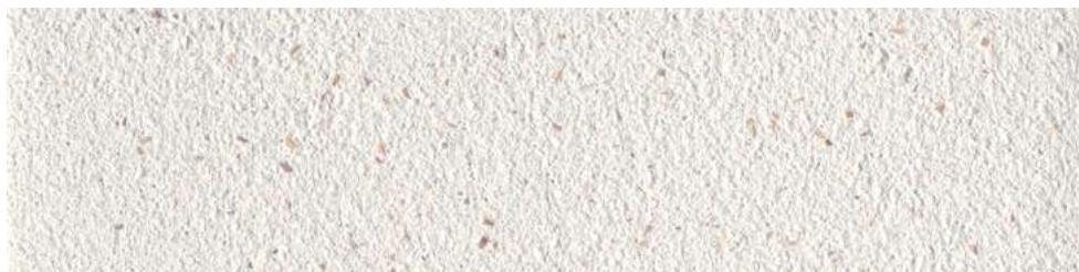
Tierrfino X-WHITE , mit gelbem Sienna 3% gefilzt