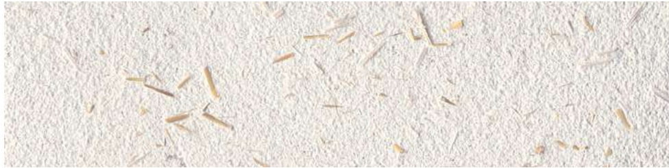
Tierrfino X-WHITE , mit Strohfasern 0,3% gefilzt