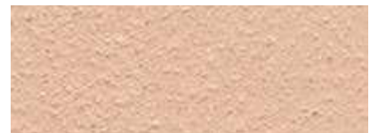
Dover Weiß 80% Djenne Rot 20%