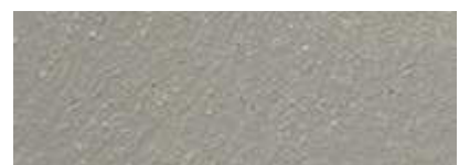
Dover Weiß 80% Gomera Grau 20%

Die abgebildeten Oberflächen sind gefilzt verarbeitet. Alle Farben sind untereinander mischbar und können mit einer zusätzlichen Pigmentzugabe verändert werden. Da es sich um einen Naturbaustoff handelt, sind geringe Farbtonabweichungen zu vorhergegangenen Lieferungen möglich. Drucktechnisch bedingte Farbabweichungen gegenüber dem Originalfarbton können nicht ausgeschlossen werden. Wir empfehlen die endgültige Auswahl anhand von Originalmustern.