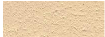
Dover Weiß 80% Römisch Ocker 20%