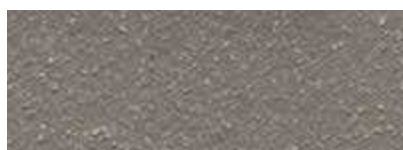
Dover Weiß 50% Gomera Grau 50%