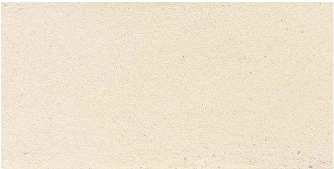
Tierrfino Finish, geglättet