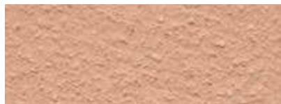
Dover Weiß 50% Djenne Rot 50%