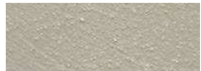
Dover Weiß 80% Iquitos Grün 20%