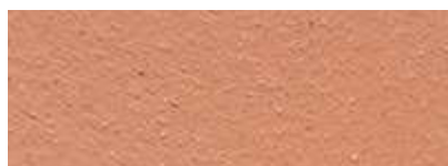
Dover Weiß 50% Ayers Rock 50%