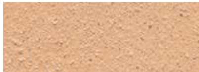
Dover Weiß 50% Nassau Orange 50%