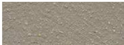
Dover Weiß 50% Iquitos Grün 50%