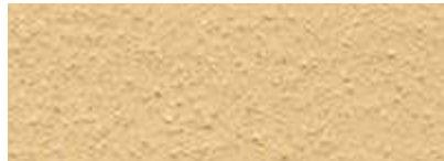
Dover Weiß 50% Römisch Ocker 50%