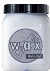
Tierrfino wax Acryl

Fordern Sie uns! Wir beraten Sie gern und finden eine optimale Lösung, um in Ihren Räumlichkeiten mit Lehm und Kalk ein gesundes und elegantes Wohnumfeld zu schaffen.