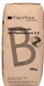
Tierrfino Base Lehmunterputz