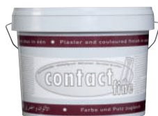
Tierrfino contact fine Haftgrund