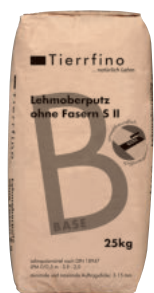
Tierrfino Base Lehmoberputz