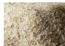
Perlmutter 0,8 - 1,2 mm