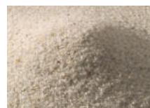
Quarzsand L 40