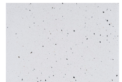
X-WHITE, mit Nero Ebano