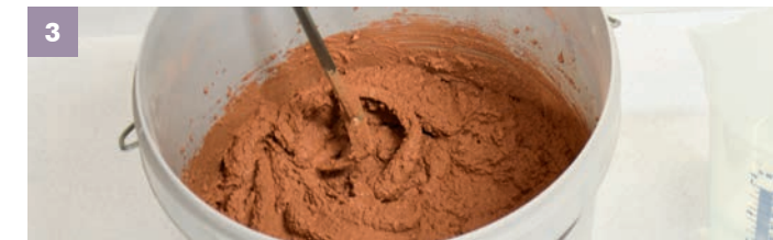
2 Den gesumpften STONE schrittweise unter weiterer geringer Wassergabe mit dem Rührquirl zu einer verarbeitungsfertigen Konsistenz aufrühren. STONE lässt sich optimal verarbeiten wenn er sämig an der Kelle haftet.