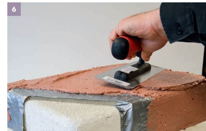
6 Nach leichtem Anziehen der ersten Schicht, die zweite Lage nass in feucht mit guter Kornüberdeckung auftragen. Die Gesamtstärke sollte bei 5 – 6 mm liegen.