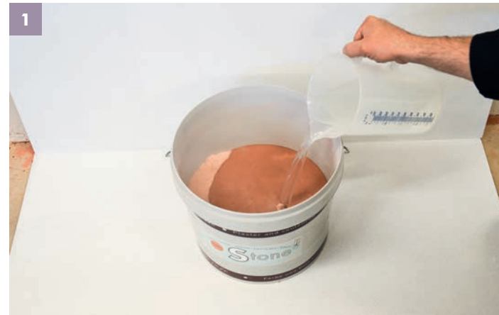
1 Gießen Sie ca. 5 – 5,5 Liter Wasser auf 12,5 kg STONE Pulver. Dann den Eimer schließen und mind. 1 Tag bis max. 30 Tage sumpfen lassen.