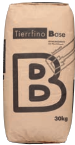
Tierrfino Base Lehmunterputz