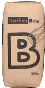
Tierrfino Base Lehmoberputz