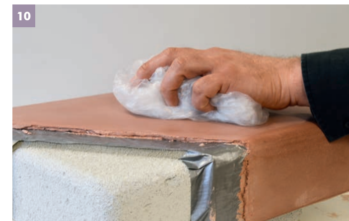
10 Um festzustellen ob der STONE schon mit dem Stein poliert werden kann, wird mit einer durchsichtigen sehr weichen Kunststoffüte vorsichtig poliert. Es ist darauf zu achten, dass sich die Oberfläche nicht mehr anlost.