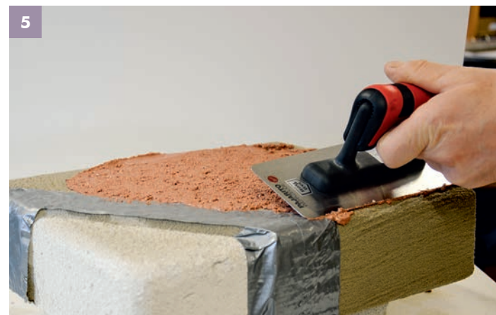
5 Aufziehen der ersten STONE Lage mit einer leichten Kornüberdeckung. Wir empfehlen einen Auftrag von ca. 2 – 3 mm.