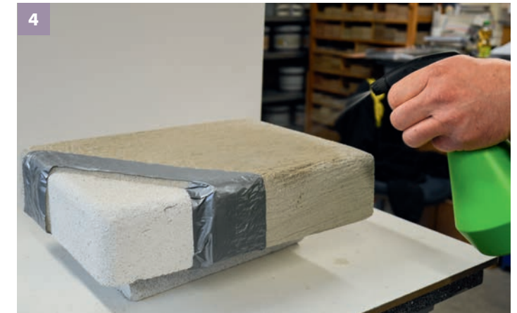
4 Der rau vorgespitzte und getrocknete Untergrund (hier: Kalk-Zementputz) ist vor dem Auftrag des STONE mehrmals vorzunässen bis eine Sättigung über mehrere Minuten erreicht ist.