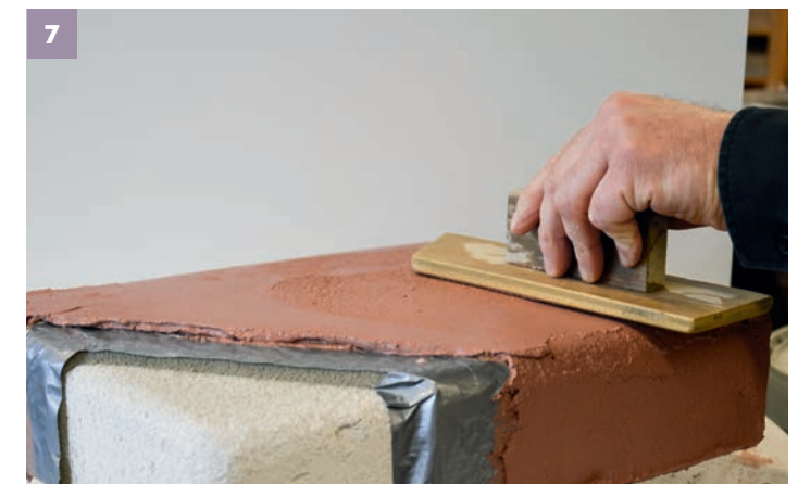
7 Zur Formgebung ist nach kurzem Trocknen der STONE mit einem Holzreibebrett abzureiben. Hierbei werden erste Feinanteile an die Oberfläche gepresst.