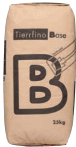
Tierrfino Base Lehmoberputz