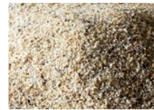
Perlmutter 0,8 – 1,2 mm