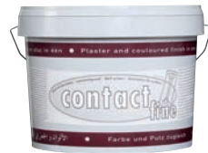
Tierrfino contact fine Haftgrund