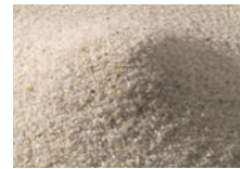
Quarzsand L 40