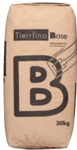
Tierrfino Base Lehmunterputz