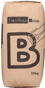
Tierrfino Base Lehmoberputz