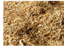
Flachsfaser 10 – 15 mm