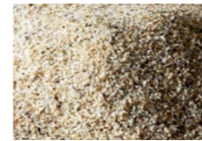
Perlmutter 0,8 – 1,2 mm