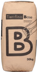
Tierrfino Base Lehmunterputz