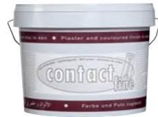
Tierrfino contact fine Haftgrund