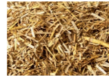
Stroh 10 – 15 mm