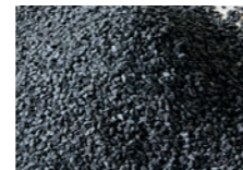
Nero Ebano 1,2 – 1,8 mm