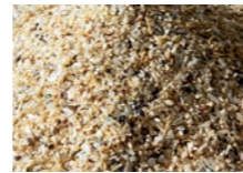
Perlmutter 1,2 – 1,8 mm