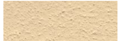
Dover Weiß 80% Römisch Ocker 20%