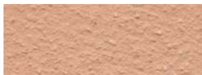
Dover Weiß 50% Djenne Rot 50%