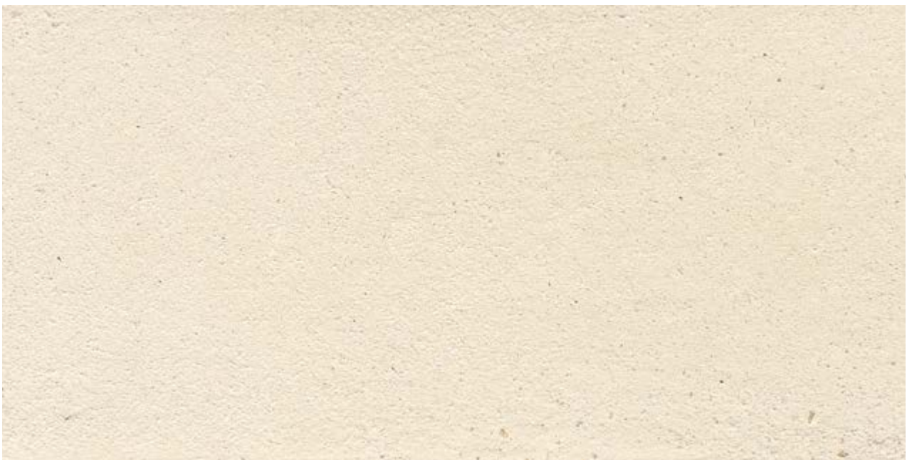
Tierrfino Finish, geglättet