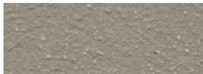
Dover Weiß 50% Iquitos Grün 50%