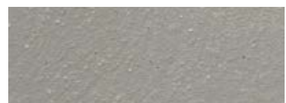
Dover Weiß 80% Gomera Grau 20%

Die abgebildeten Oberflächen sind gefilzt verarbeitet.