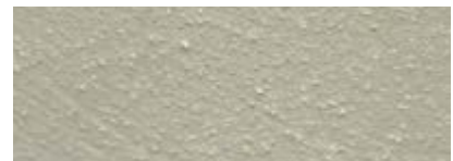
Dover Weiß 80% Iquitos Grün 20%