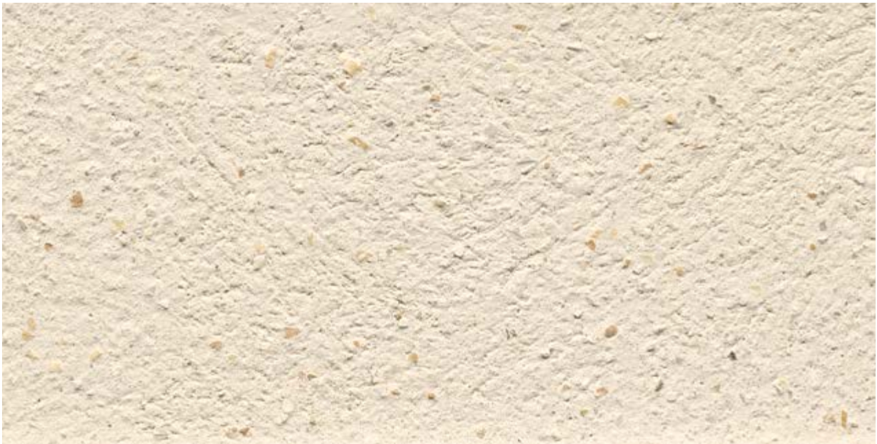
Tierrfino Finish, gefilzt